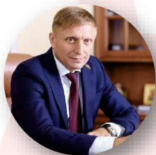
Сергей Кириенко Первый заместитель руководителя Администрации Президента Российской Федерации

В ходе торжественного открытия первичного отделения РДДМ «Движение Первых» в московской школе № 1529 имени А. С. Грибоедова (20 декабря, Москва):