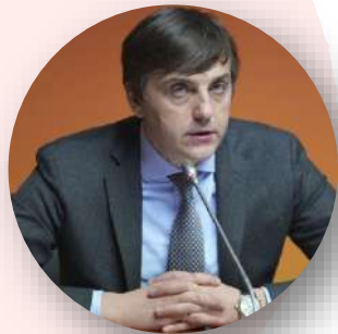
Сергей Кравцов Министр просвещения Российской Федерации

«Наверное, скажу об этом впервые: мы идём к тому, чтобы от вариативности, которая была заложена в Законе «Об образовании в Российской Федерации», перейти к единым программам, никоим образом не исключая возможность самореализации учителей, использования различных методик, своих подходов. Тем не менее мы установим определённые требования высокого уровня, понятные по содержанию, для того чтобы школьники вне зависимости от того, где они обучаются, получали качественное образование»